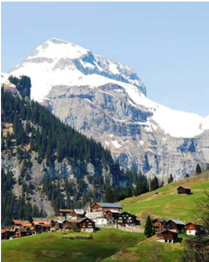
Das Dörfchen Pigniu mit dem dominanten Péz Fluaz im Hintergrund.