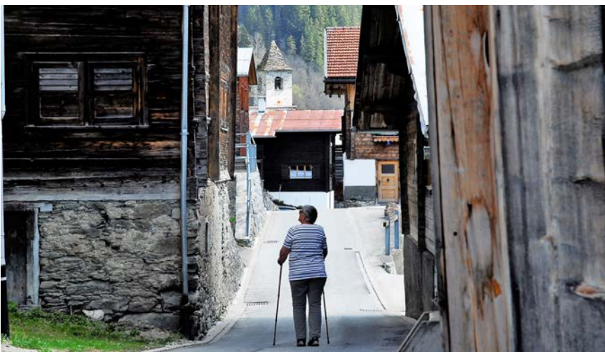
Auf der Dorfstrasse von Pigniu begegnet man nicht vielen Menschen. Im Dorf leben ständig rund 20 Personen.

Il vitget da Pigniu ei colligiau cul general Alexander Wassiljewitsch Suworow (1729–1800). Quel ei arrivaus cheu ils 6 e 7 d'october 1799 cun sia armada da circa 15 000 umens e cavals. Partius era el cun 22 000 umens ed animals ell'Italia dil nord. Ella Lumbardia fuvi gartegiau a Suworow da scatschar ils Franzos. El ha retschert il camond da serender encunter Turitg per sustener general Korsakow. Ella cavorgia da Caschinutta ei sia armada fruntada sils Franzos che sias truppas han dumignau. Ils Franzos ein denton serevegni ed han catschau Suworow. Sia armada havess duiv ir en agid a Korsakow, ils Franzos han denton battiu lezz'armada sper Turitg. Aschia ei Suworow vegniu ellas stretgas. Catschias davon e davos eis el sedecidius dad untgir encunter ost. El ha surmuntau ils pass Kinzig ella Val dalla Muota, leu fuvan ils Franzos. El ha stuiu seretrer en cumplein cumbat sur il pass dil Praghel encunter Glaruna. Era leu fuva igl inimitg, aschia ch'el ha stuiu sedecider dad ir en direcziun sid sur il Veptga. Durent il strapaz horribel tras neiv e ferdaglias han mellis umens piars la veta. A Pigniu ha la finala ina armada fomentada e spossada invadau il vitget da 70 habitonts. Suworow ha priu quartier tier Rest Antoni Spescha. Tgi che va oz tras il vitg, vesa la tabla commemorativa vid la casa.