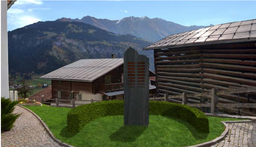
Ein Gemeinschaftsgrab für jede Fraktion: Hier eine Visualisierung der geplanten Anlage auf dem Friedhof in Luven.

ront tschentaners, tenor rituals clars per omisduas confessiuns. Oz ei quei semidau, la gronda part dils defuncts vegnan cremai. La cultura da prender cumiau ei semidada e las sutterradas vegnan organisadas individualmein. Biars confamigliars vivan oz ordeifer ils vitgs ni giu la Bassa. Perquei dat ei oz la fossa comunabla. Ils impuls per in tal implont comunabel per satrar urnas senza stuer cultivar fossas, fluras e decoraziuns, deriva dalla populaziun sezza. Ella vischnaunca Ilanz/Glion dat ei gia en pliras fracziuns ina fossa comunabla, aschia a Castrisch, Sevegin e sin omisduas santeris a Glion. Ina fossa comunabla ei la vischnaunca vidlunder da scaffir a Ruschein, Rueun e Luven. Tochen gl'atun 2018 duessen ils projects esser fini, lu suondan ils auters, gest tenor prioritad. La fuorma dall'installaziun duei esser individuala per tuts santeris, denton unificada els cuosts ed el manteniment.