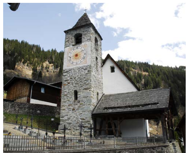
Die Pfarrkirche von Pigniu ist dem Heiligen Valentin geweiht.