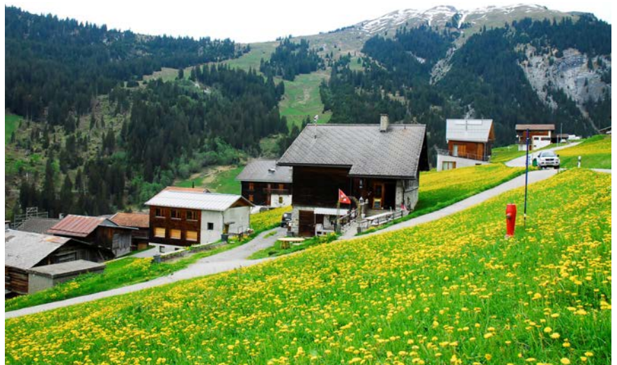
Das im Jahre 1953 erstellte Schulhaus (vorne) wurde 1983 zum Restaurant und übernahm den Namen der ehemaligen Wirtschaft «Alpina». Links davon das im Jahr 2000 eingeweihte Gemeindehaus.