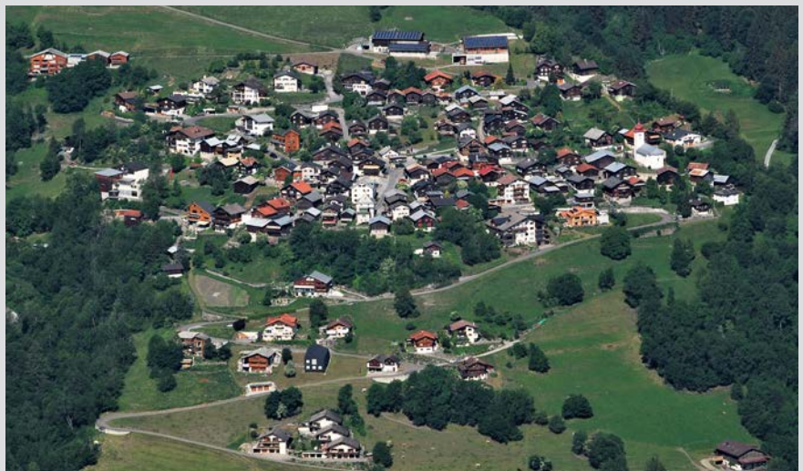
Luven im Sommer 2018.