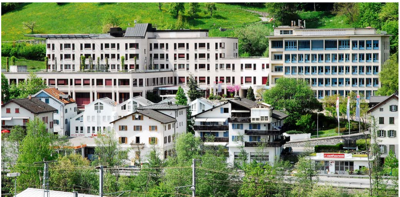
Das Regionalspital Surselva dient einem Einzugsgebiet mit rund 24 000 ständigen Einwohnern und Tausenden von Feriengästen.

Für die Grundversorgung ist der Hausarzt oder die Hausärztin weiterhin unentbehrlich. Sie machen die Diagnose, die Triage und leiten die weiteren Behandlungsschritte ein. Hausärzte können aber auch künftig keine Operationen durchführen. Dem allgemeinen Trend können sie sich, genau wie wir Spitäler, nicht entgegenstellen. Man muss bedenken, dass Routineoperationen wie z.B. ein Leistenbruch oder viele andere chirurgische Eingriffe in Zukunft ambulant durchgeführt werden. Für alle Spitäler, auch das Kantonsspital, wird der Trend von der stationären hin zur ambulanten Spitalbehandlung Tatsache gehen.