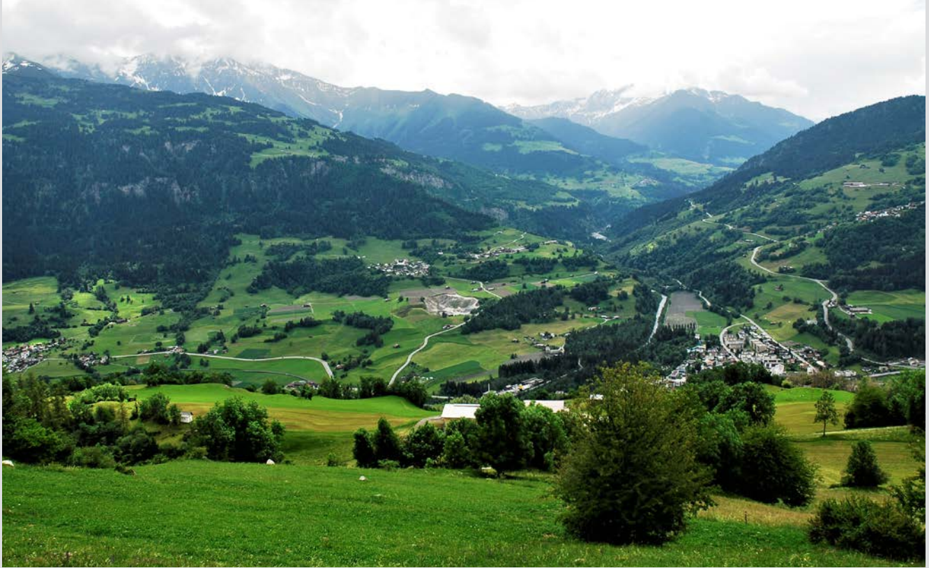
Blick in die Foppa/Gruob. Von Ladir aus schaut man auf sieben Fraktionen.

Seit der letzten Ausgabe der TABLA NERA sind wiederum einige Entscheide gefällt, Geschäfte vorange- trieben und neue angestossen worden. An der letzten Sitzung Ende 2017 hat das Gemeindeparlament das Budget 2018 an den Gemeindevorstand zu- rückgewiesen mit Sparaufträgen in den Bereichen Forst und Bildung. So konnte das definitive Budget erst Mit- te Februar 2018 verabschiedet wer- den. Dies hatte zur Folge, dass Ge- meindevorstand und Verwaltung in den ersten Monaten des neuen Jahres ohne genehmigtes Budget arbeiten mussten. Die ordentlichen Aufgaben konnten gleichwohl gut erfüllt wer- den. Neue Projekte konnten hingegen erst im Frühjahr, nach Ablauf der Re- ferendumsfrist, angestossen werden.