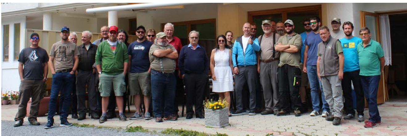
L'uniun da pescadurs da Castrisch sin viadi, avon il hotel a Galtür.

president actual preparan els il program annual. Igl onn d'uniun entscheiva miez mars culla radunanza generala. Miez matg cloma la suprastanza alla lavur cumina, lu suonda il fenadur la concorrenza da pescar e la fiasta dils pescadurs cul survetsch divin da pescadurs. Quella fiasta ei enconuschenta lunsch entuorn. Mintg'onn la secunda fin d'jamna dil fenadur ei quella fiasta giu l'Isla sut spel Rein. Tochen avon dus onns fuva ella cumbinada culla concorrenza da pescar. Demai ch'ils commembers fuvan lu sfurzai da luvrar han els decidiu d'organisar la fiasta in'jamna pli tard. Igl uost suonda lu la pagaglia per tutta lavur prestada. Mintg'onn va l'uniun sin viadi. Avon zacons onns han ins scuviert la cuntrada da Galtür ora el Montafon/Austria sco destinaziun ideala. Igl ei ina sonda e dumengia che tuts gaudan cun pescar e star pacific da cumpignia. Tut ils commembers dall'uniun ein dil reminent integrai el program da lavur cun preparar il laghet da tratga, survegilar igl automat da pavlar, metter ora pèschs pigns e star a disposiziun per activitads spontanans.