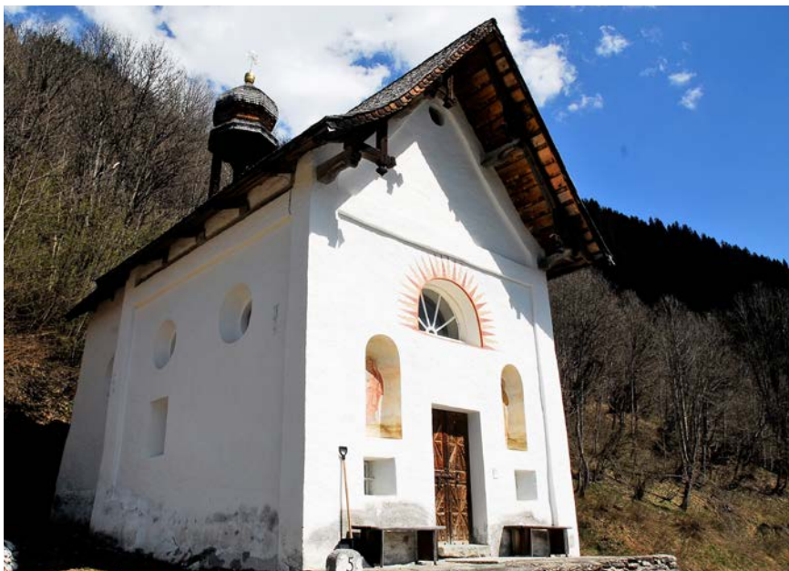
Nua ei quella caplutta e co senumna ella?

Cotschna-Fotorätsel, Rathaus, Piazza Cumin 9, 7130 Ilanz. Vergessen Sie nicht Ihre Telefonnummer oder Ihre Mail-Adresse zu notieren. Man kann die Karte auch unfrankiert direkt in den Briefkasten der Gemeindeverwaltung werfen. Alle Karten mit der richtigen Lösung kommen in die Urne und das Los entscheidet über einen Ilanz-Geschenkgutschein im Wert von 100 Franken sowie das Ilanzer Buch. Die Teilnahme ist Einwohnerinnen und Einwohner der Gemeinde Ilanz/Glion vorbehalten. Der Sieger/die Siegerin wird ins Rathaus zur Preisübergabe eingeladen.