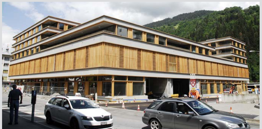
Das Zentrum Marceau wird im September 2018 eröffnet. Es ist ein städtebaulicher Markstein für Ilanz.