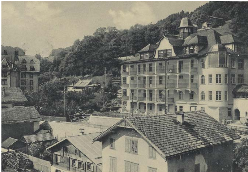
Das alte Spitalgebäude, erbaut 1913, wurde 1986 abgebrochen, um einem Neubau Platz zu machen.

(abc) La historia dil Spital regional Surselva ei colligiada culla claustra dallas soras dominicanas e cul fundatur da quella, Gion Fidel Depuoz (1817–1875). Il convischin da Siat ei staus ina personalitad briglianta ella Surselva dalla secunda mesadad dil 19avel tschentaner. L'industrialisaziun haveva entschiet e targeva bia gliued en fabricas e menaschis gronds. Tuts scalems socials dalla populaziun pitevan d'ina euforia industrial. En Surselva regeva el medem mument gronda pupira ed atmosfera da partenza. En mintga vischnaunca fuva il pauperesser ina sparta che caschunava gronds cuosts e quitaus allas autoritads. Siu senn per giustia sociala, agid al proxim e l'affecziun per la patria han intimau Depuoz, il teolog e profeser cun vast horizont, d'agir. Oriundamein havess el bugen aviert a Siat ina casa d'orfans cun spital. El ha seschau