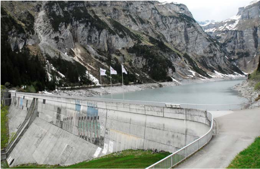
Die Staumauer und der See auf 1450 m. ü. M. wurden 1986–1989 zuhinterst im Val da Pigniu erstellt.