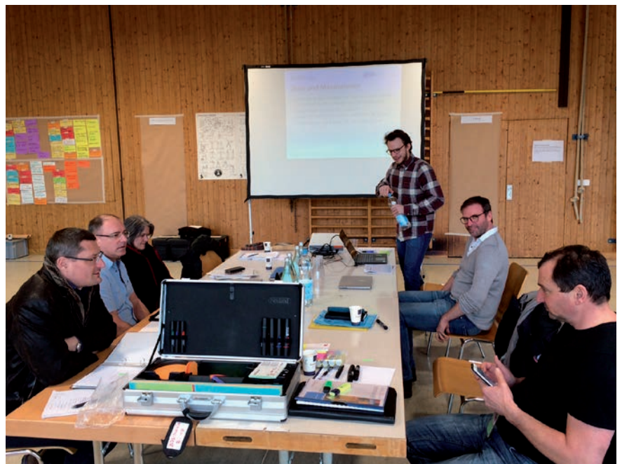
Suprastonza e direcziun communal en clausura a Luven.

Am 2. März haben Gemeindevorstand und Geschäftsleitung in der Turnhalle von Luven einen Tag lang über Stärken und Schwächen der Gemeinde nachgedacht, Trends der Zukunft überlegt, Chancen diskutiert, welche zu nutzen sind, und Risiken erörtert, die wir reduzieren sollten. Es wurde rege und intensiv diskutiert. Obwohl die Arbeit noch nicht abgeschlossen ist, hier ein kleiner Werkstattbericht mit ein paar Aussagen: