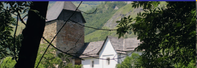
Kirche in Surcasti

Weitere Informationen und alle Fahrpläne sind zu finden unter: Ulteriori informazioni e gli orari sono consultabili in: www.busalpin.ch