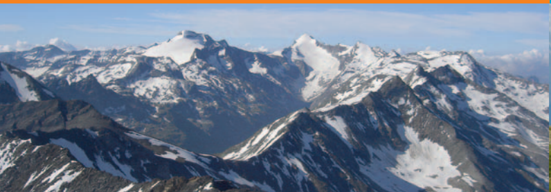
Teil der Adula-Alpen