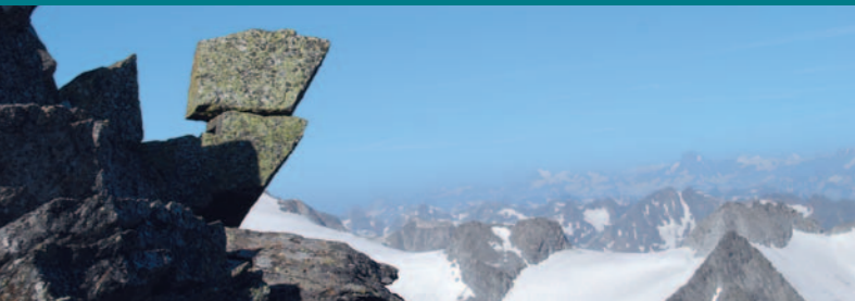
Piz Valdraus (Medelsergletscher)

Ein öffentliches Telefon finden Sie bei der Staumauer (schlechter Empfang für Mobiltelefone). Un telefono pubblico è a disposizione alla diga (scarsa ricezione con il telefono mobile).