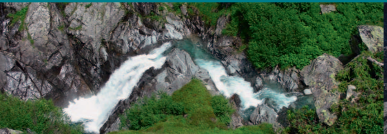
Wasserfälle in Val Sumvitg

La terrazza soleggiata di Obersaxen Mundaun è uno degli altopiani più belli dei Grigioni. 29 cascin e fattorie ubicate tra 1003 e 1430 m. s. m. fanno da cornice alla regione di Obersaxen, considerata un’enclave della civiltà Walser, inserita nel cuore della regione linguistica retoromanca. Una rara realtà che si riflette sia nella storia carica di cultura che nel carattere dei circa 800 abitanti. Il paesaggio si mostra inaspettatamente generoso, ampio e incornciato da imponenti catene montuose. Lontano dalla strada trafficata a Obersaxen Mundaun il turista trova tranquillità, libertà e indipendenza a stretto contatto con la natura. L’estate a Obersaxen Mundaun offre puro relax agli ospiti in cerca di tranquillità e alle famiglie. Ma non è solo questo: lungo i 150 km di sentieri escursionistici ben segnalati, si può godere di un panorama da favola ai piedi delle montagne grigionesi. Obersaxen offre agli escursionisti la possibilità di recarsi a Ilanz con i trasporti pubblici per poi raggiungere la Greina.