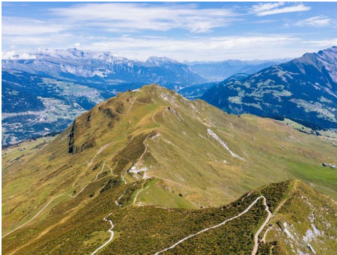
Trutg panoramic