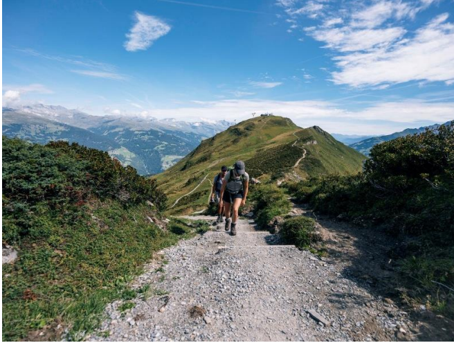
Ascensiun al Hitzeggen