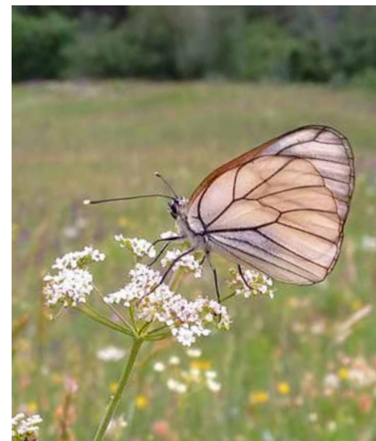
Baumweissling (Schmetterling) auf Bibernelle ( Pimpinella saxifraga ) in der Trockenwiese und -weide unterhalb von Duvin (Pisque).