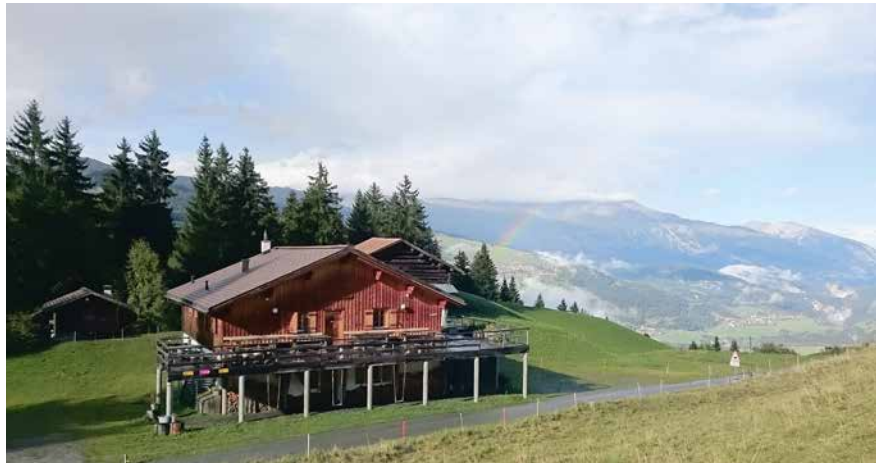
L'ustria Sasolas sur Luven s'auda tier las 300 immobiglias che la vischnaunca Ilanz/Glion ha d'administrar. Era ella ei includida ella strategia d'immobiglias.

Der Gemeindevorstand hat zur Klärung dieser komplexen Fragen und im Auftrag des Parlaments die Erarbeitung einer Immobilienstrategie gestartet. Ziel dieser Arbeit ist es, eine nachvollziehbare Grundlage für den künftigen Umgang mit diesen Bauten zu schaffen, die Wirtschaftlichkeit zu erhöhen und strategische Vorschläge zu erarbeiten,