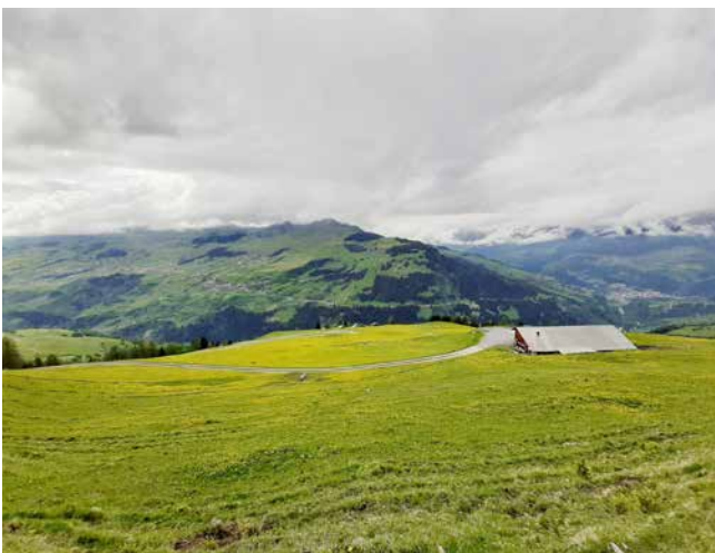
L'Alp Runca sin 1450 m.s.m., baghegiada 1961, vegn cargada sco ina dalle empremas en Surselva.

1961 han ins inaugurau leu l'emprema pipeline da latg. Il conduct menava directamein giu ella cascharia dil vitg. Oz carkan tshun purs 80 vaccas-mumma e 200 nuorsas sillas alps entuorn la Botta Burschina.