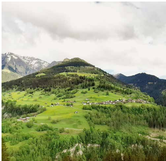
Il vitg da Pitasch schai ella leva spunda dalla Botta Burschina.