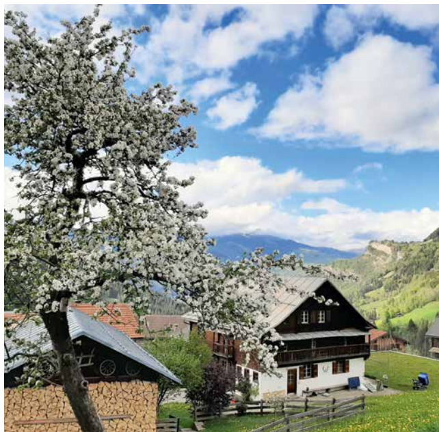
In vitg sco malegiaus.

Igl uoppen da Pitasch muossa sin funs d'argien treis pégnis verds sin in cuolm, era en verd. Igl uoppen corrispunda al vegl sigil da vischnaunca. Igl emblem ei evidents, pertgei la mesadad dalla surfatscha da rodund 1100 hectaras ei uaul. Tochen ils 31 da december 2013 fuva Pitasch ina vischnaunca politica dil cumin dalla Foppa, malgrad ch'ella s'auda geograficamein tier la Lumnezia. Quei ei da declarar culla topografia e la historia. Tochen 1487 s'udeva Pitasch tier la pleiv gronda da Sagogn che fuva en possess dalla claustra da s. Gliezi da Cuera. Duront 1000 onns ha il Cuolm Stussavgia giu gronda muntada per Pitasch. Rutas da marcadonts, feudals, pelegrins e schuldada menavan da Dialma/Elm a Flem, vinavon en direziun sid traver-