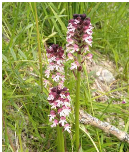
Schwärzliche Knabenkraut ( Orchis ustulata ) in der Trockenwiese «Vintgins», oberhalb von Ilanz und vom Hof Salens.

Waldrand die meisten Pflanzenarten vorkommen. In diesem Bereich des Gebüschsaums waren vereinzelt Sträucher oder Strauchgruppen im Offenland vorhanden, die Beschattung durch diese war jedoch geringer als 25 %. So zählte ich im offeneren Bereich der Wiese pro Aufnahmefläche ( \approx 3 \text{ m}^2 ) rund 25 verschiedene Pflanzenarten, während im angrenzenden Gebüsch meist nur 17 unterschiedliche Pflanzen vorkamen. Andererseits habe ich auch gefährdete und geschützte Pflanzenarten genauer betrachtet. Diesbezüglich zeigt sich deutlich, dass im offenen, besonnten Bereich der Trockenwiese und -weide die meisten seltenen Pflanzen wachsen. So z. B. das Finger-Bartgras bei Pitasch (Grotta)