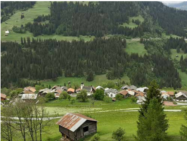
Vista da sud verso Pitasch. In vista la via lunigiana.