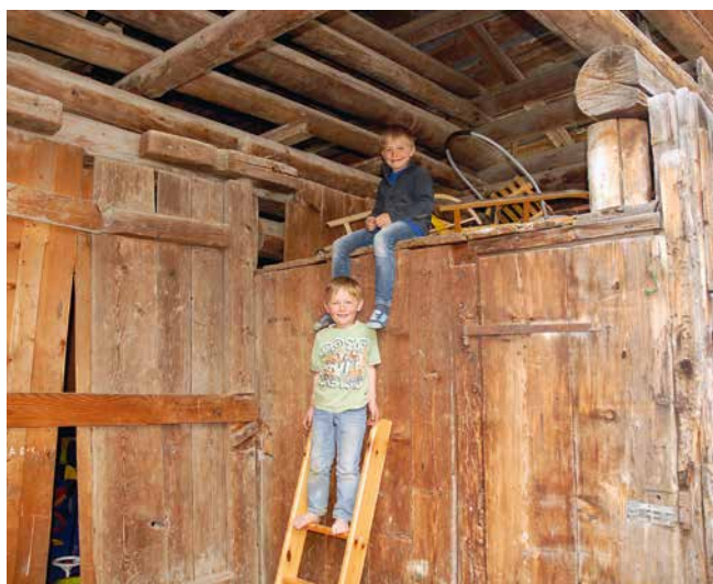
Ina sentupada amiez il vitg da Pitasch.

1538, 12 onns sunter che las Treis Ligias han decidiu a Glion ils artechels dall'autonomia confessionala, ha igl uestg vendiu ses dretgs al cumin aschia che Pitasch ha contonschiu cumpleina libertad. Influenzai dalla cardientscha nova han ins curclau ils maletgs gotics ella baselgia. Duront 476 onns ei il vitg, cun ses dus uclauns Cabiena e Cuolm Selvadi, antruras habitai sur onn, staus ina vischnaunca autonoma. Dapi 1850 tochen oz han adina denter 100 tochen 125 carstgauns habitau cheu. Culla votaziun dils 16 da november 2012 ein quels sedecidi da s'unir culla nova vischnaunca gronda Ilanz/Glion. Ina via carrabla ha Pitasch retschert per sunter 1860,