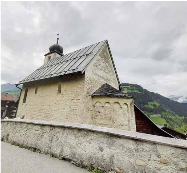
L'unica basilica della regione con un'abside romana con colonnette.