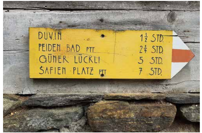
Una tavola vecchia dalle stampe da viandare, amiche il vitigno.