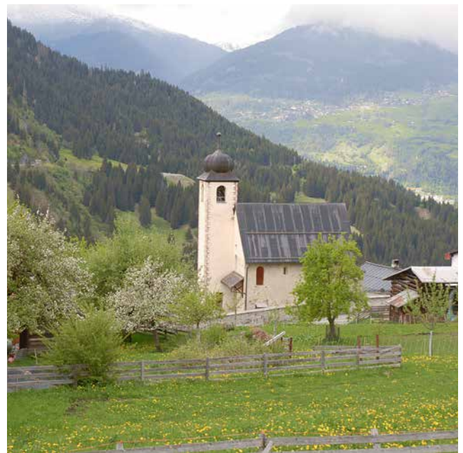
Il toponimo del 15° secolo tschentaner deriva da Pitasch in hospite.

igl ei la colligaziun dad oz naven dil funs dil Glogn. Il cantun Grischun ha baghegiu quella naven dil Mulin da Pitasch. 1984 han ils da Pitasch instradau la meglieraziun da funs, quei project epocal ha giu gronda influenza pil pu-