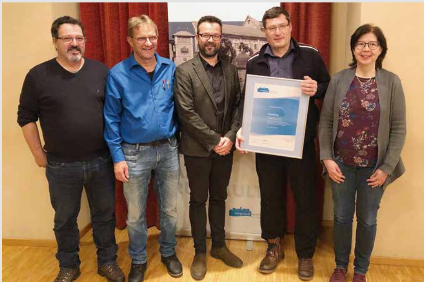
Label-Übergabe am 19. Februar 2020.

d'energia e da traffic Grischun, surdau alla cumission d'energia il label marcau d'energia Ilanz/Glion. La vischnaunca Ilanz/Glion era gia marcau d'energia e sa aschia renovar il label ella rama dil reaudit. Aschia presta la vischnaunca in'impurtonta contribuziun alla reduziun dallas emissiuns da CO 2 sco era ad in diever persistent dallas resursas.