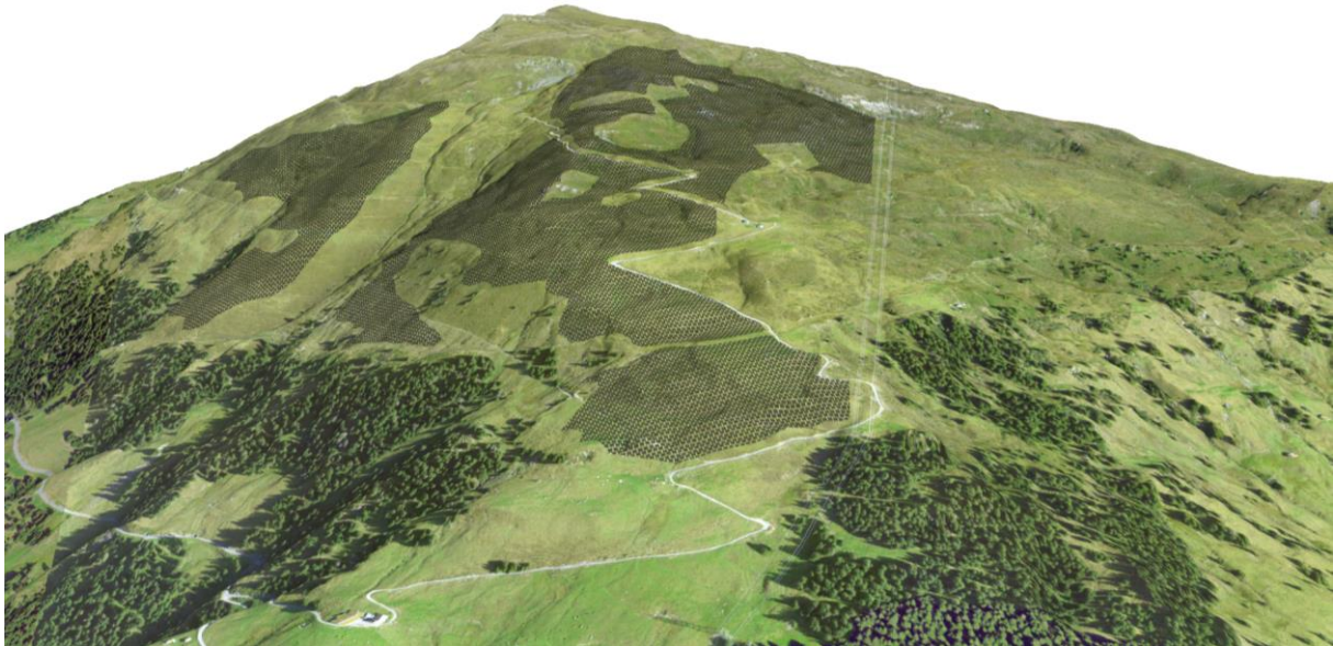
Abbildung 2: Projektperimeter (Planungsstand September 2023)

Auf einer Fläche von ca. 500'000 m 2 könnte auf der Alp da Rueun Sura eine 30 Megawattpeak (MWp) starke Photovoltaikanlage ca. 50 Mio. Kilowattstunden (kWh) Solarstrom pro Jahr erzeugen. Damit könnte der Jahresverbrauch von rund 9'400 Haushalten gedeckt werden.